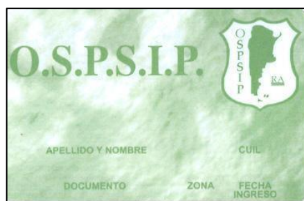
Familiar a cargo