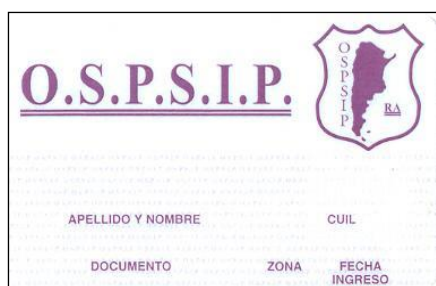
Titular y grupo familiar